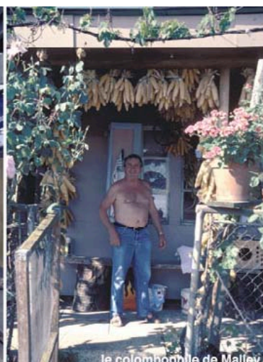
le colombophile de Mallev