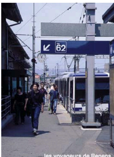
les voyageurs de Renens