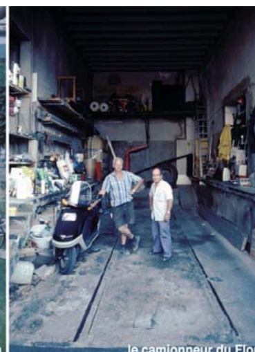
le camionneur du Flon