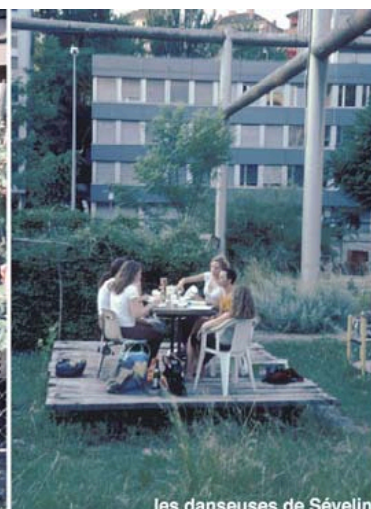
les danseuses de Sévelin